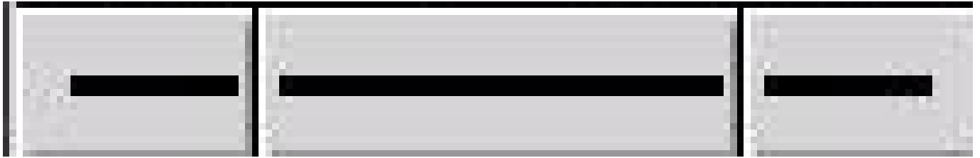
Figure 3.2: Właściwości linii

Linie mogą być w prosty sposób modyfikowane w celu tworzenia elementów jak np. strzałki. Na dole skrzynki narzędziowej znajdują się 3 przyciski z symbolami linii. Kliknięcie i przytrzymanie spowoduje otwarcie menu demonstrującego wygląd linii.